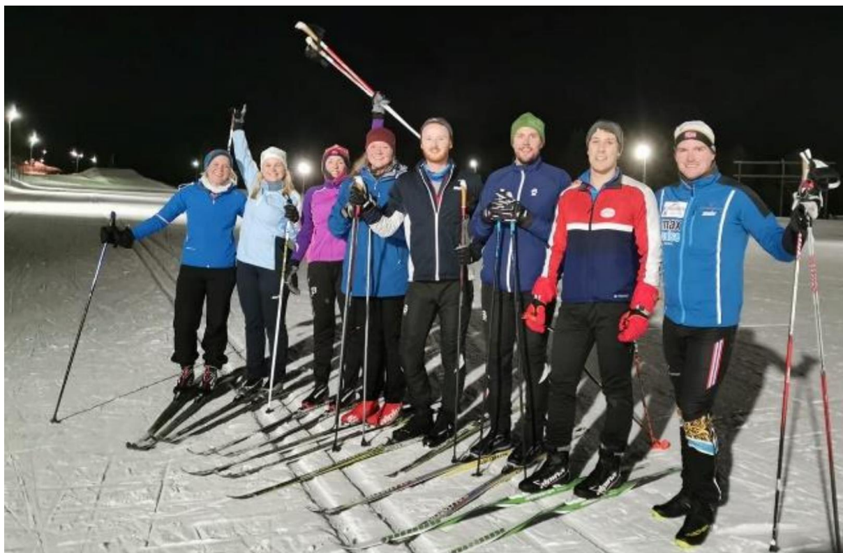
Fra skiteknikk-kurset med Tekna Ung, 4. februar.

Pga pandemien er det mange arrangementer som ikke har kunnet gjennomføres i 2020. Besøket til Newtonrommet som vi fikk samfunnsmidler til, måtte avlyses da Ringsaker kommune ble «rød». Pandemien satte også en stopper for den månedlige quizzen på Heim, som tidligere har gjort det mulig å avgjøre hvilken avdeling som har de beste quizmasterne (Lillehammer hadde en klar ledelse så vidt vi husker).