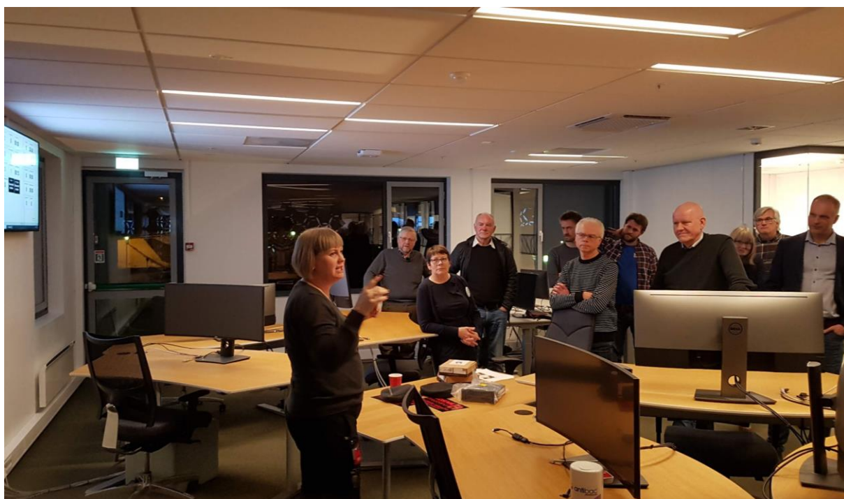
Bedriftsbesøk Eidsiva bredbånd 4. februar