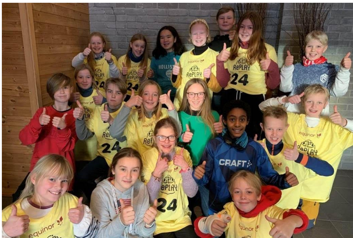
Team «Rett i ryggen» etter at prosjektprisen i FLL skandinavisk finale var hentet hjem.

Og neste år håper vi at vi kan få med deltagere også fra vårt område i FLL.