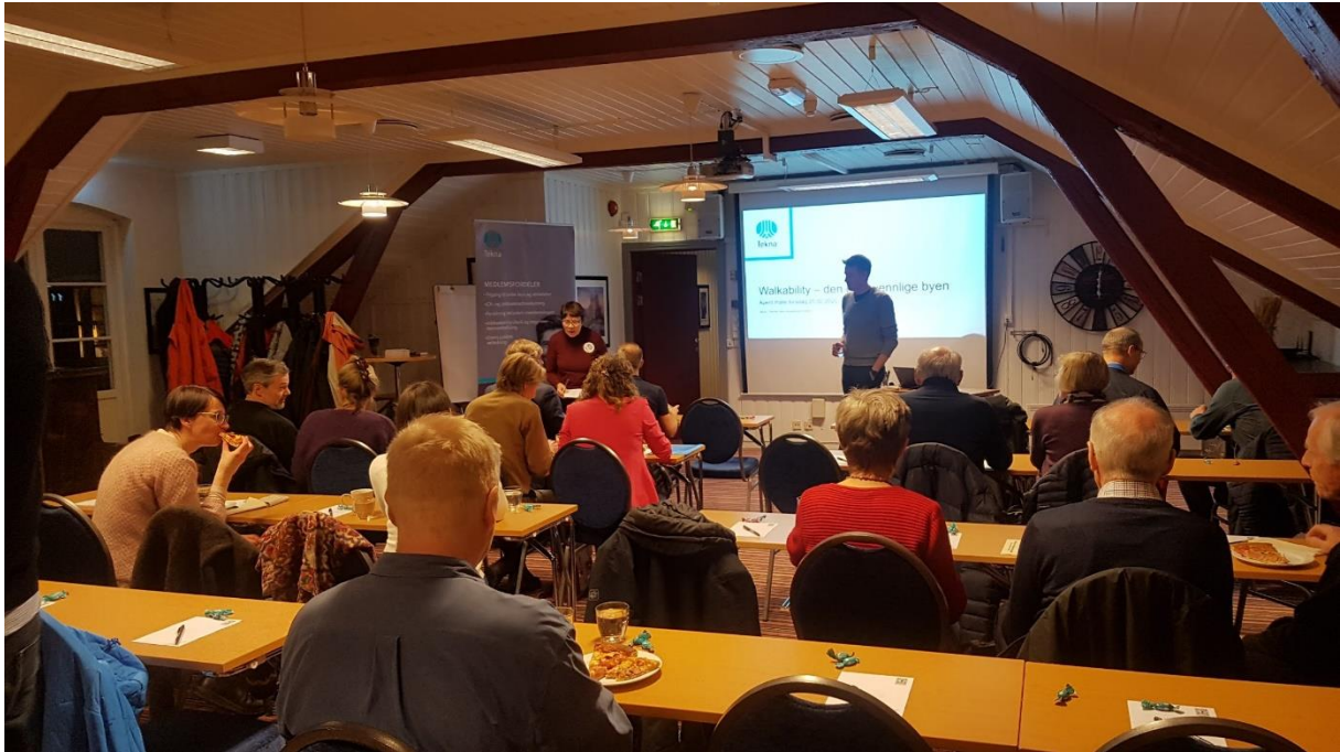
Fra arrangementet Walkability - den gangvennlige byen, på Mølla hotell, 20. februar 2020

I budsjettet for neste år foreslår vi å sette av 3% av kontingenten til felles nasjonale digitale tilbudet slik det ble foreslått i avdelingsledermøtet i oktober.