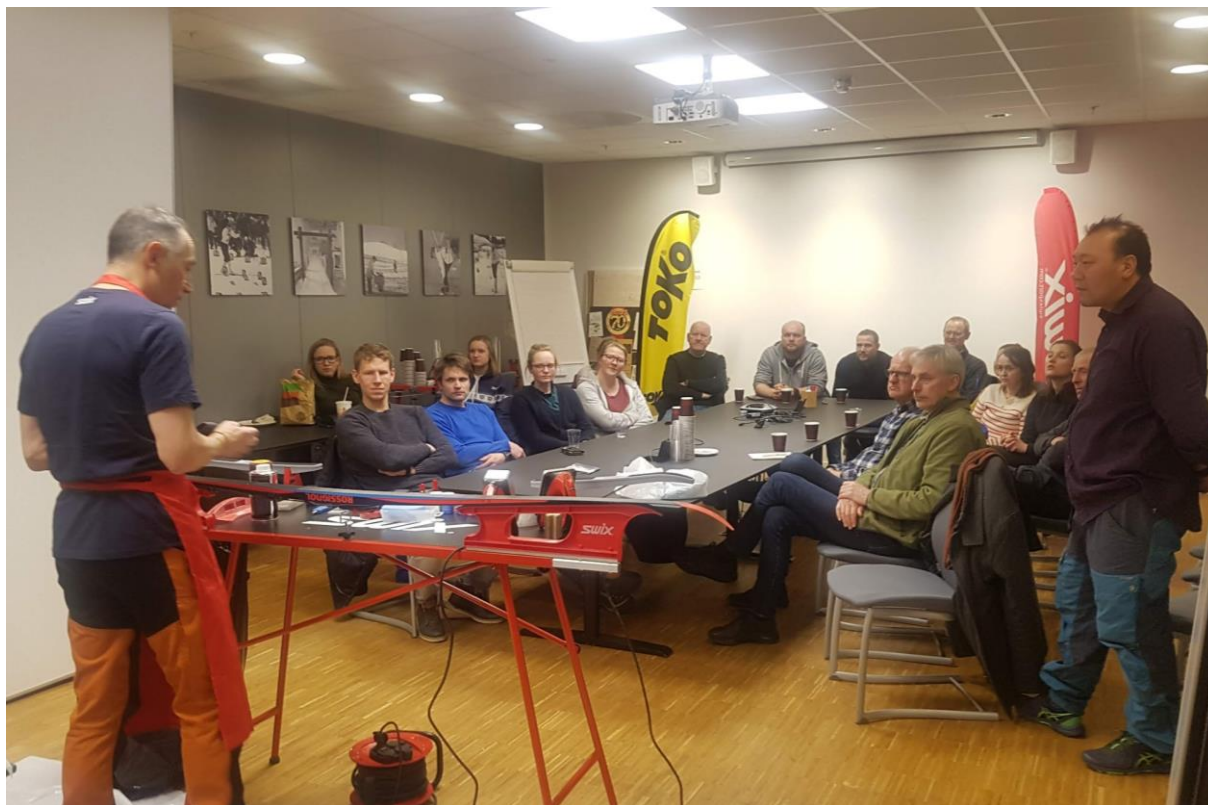
Smørekurs på Swix, 25. februar