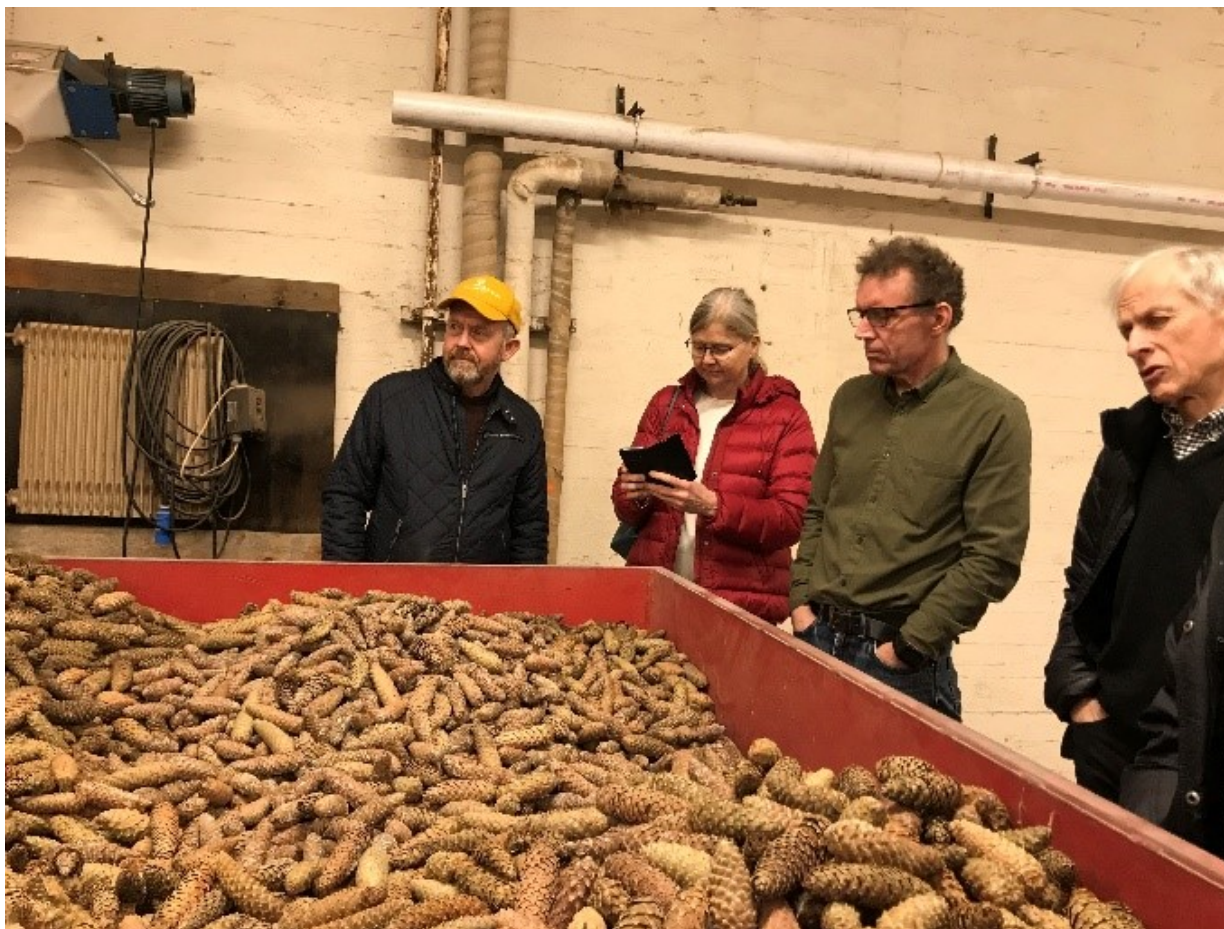
Omvisning på Skogfrøverket i Hamar