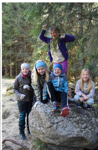
Nytt klasserom i skogen og Naturskolen med uteskole