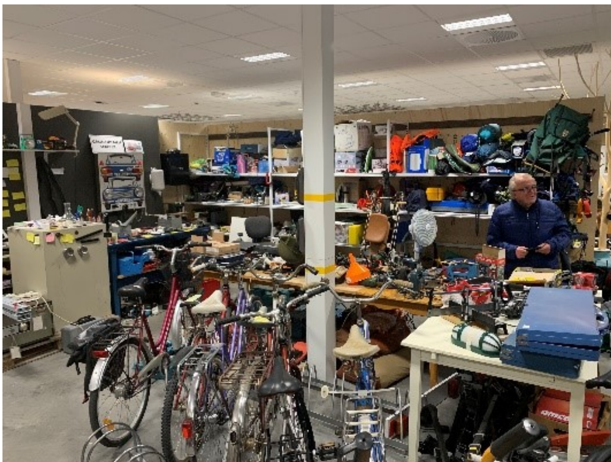
Foredrag og omvisning hos Kretsløpsparken på Gålås

Andre planer som er utsatt på ubestemt tid: