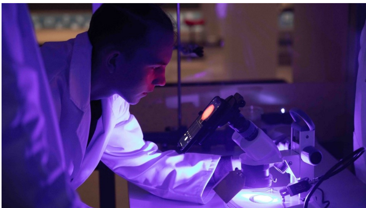
Newton-rommet i Ringsaker