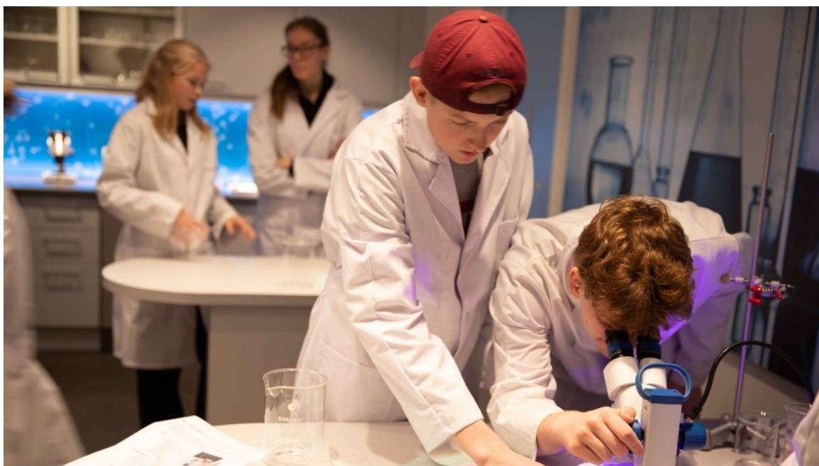
Newton-rommet i Ringsaker