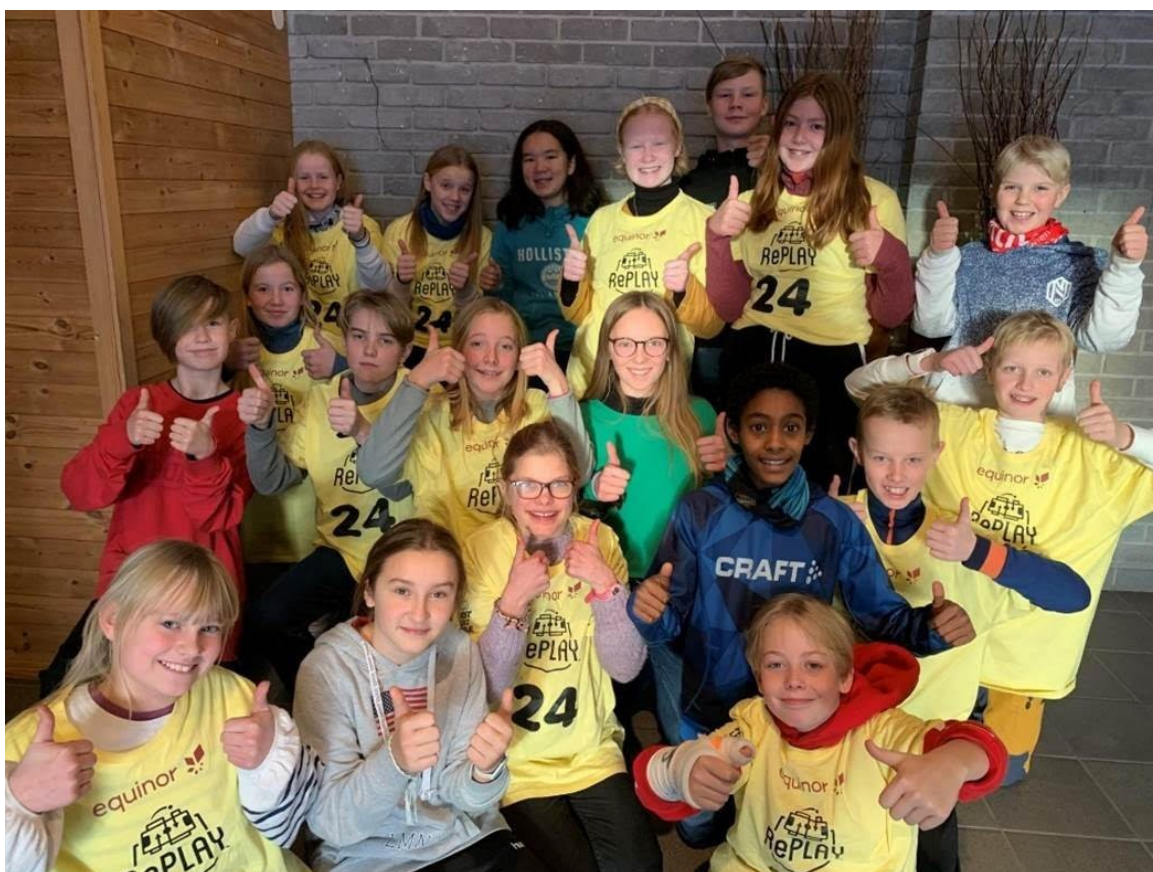
Team rett i ryggen etter at prosjektprisen i FLL skandinavisk finale var hentet hjem.