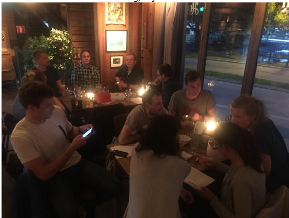
Tekna Ung quiz arrangert av Tekna Ung