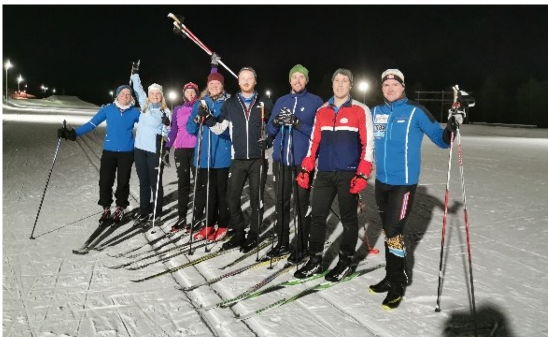
Fra skiteknikk-kurset med Tekna Ung, 4. februar 2020