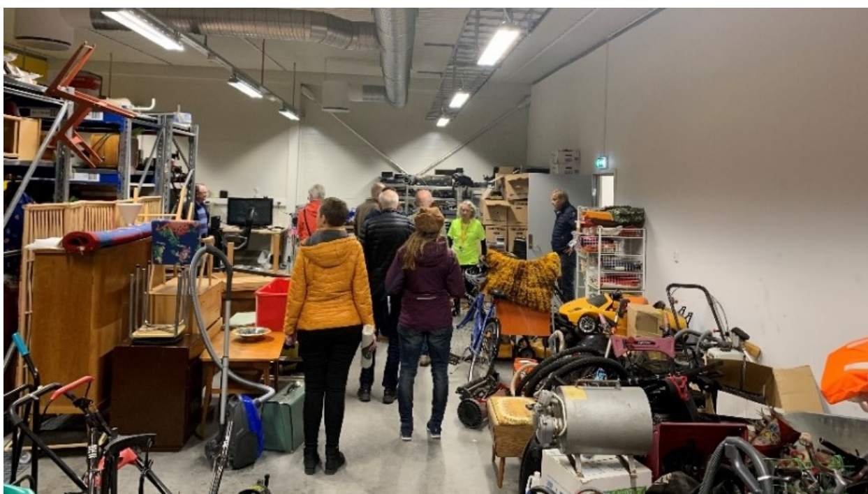
Foredrag og omvisning hos Kretsløpsparken på Gålås