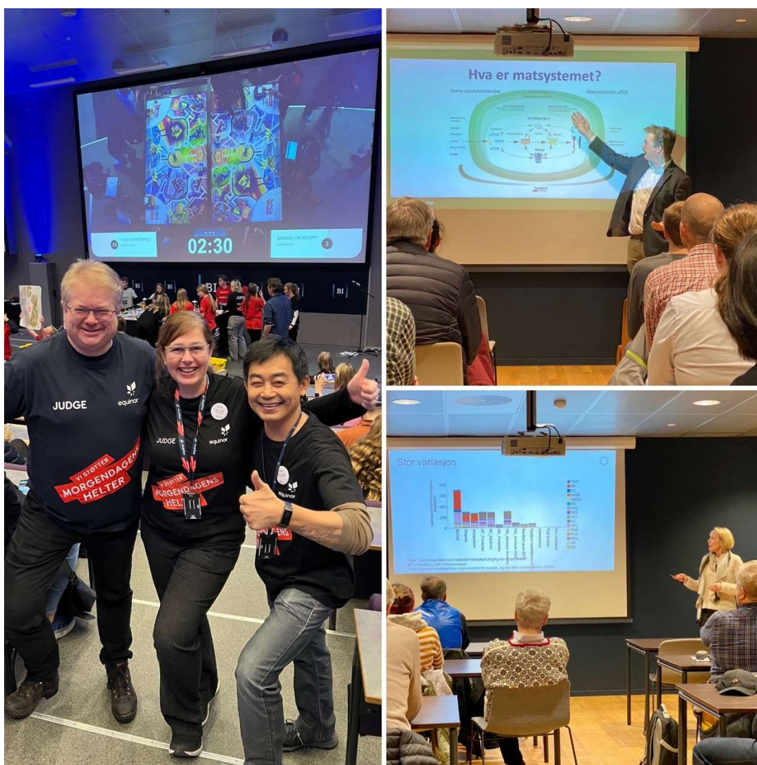
Figur 6. Bilder fra noen av fagrådets aktiviteter gjennom året.

Av utfordringer i dette kommende året så er det kanskje å beholde våre engasjerte og dyktige tillitsvalgte som ofte har en travel hverdag både på jobb og etterpå. Tillitsvalgte på fagsiden har ikke lovfestet fri til å jobbe med dette, så mange bruker fritiden sin på å gi medlemmene et godt faglig tilbud. Å kunne gi noe tilbake til dem blir enda viktigere framover, og forhåpentligvis vil dette året med jubileumsaktiviteter bidra til å sikre engasjement og vilje til å delta i flere år videre.