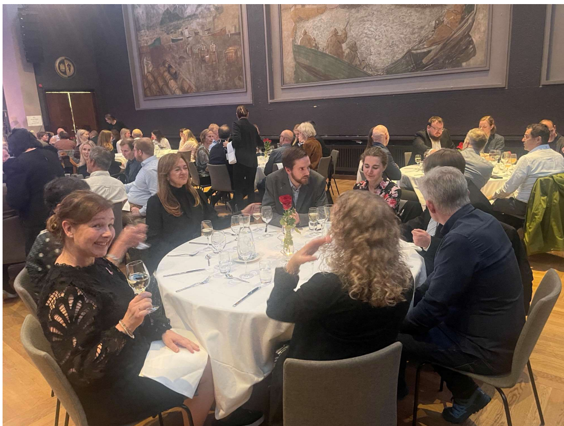
Figur 4. Bilde fra Hyllest til de tillitsvalgte.